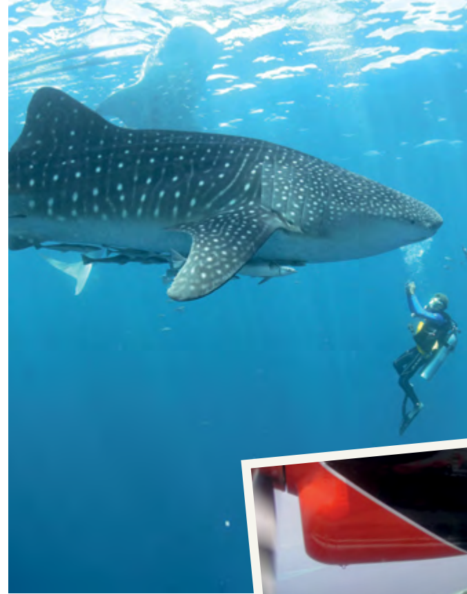
Soldan saat yönünde: Balina köpekbalığıyla yüzmek; Santorini'deki Oia'nın teraslarından Ege'ye bakış; Fira köyünden krater manzarası; uçaktan Maldivler.